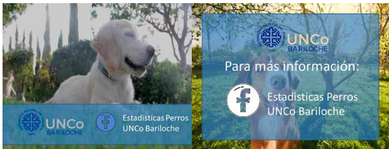
Figura 4. Portada y cierre de video sobre prevención de mordeduras de perro.

El Código Sanitario para los Animales Terrestres de 2019, elaborado por la Organización Mundial de Sanidad Animal (OIE) tiene un capítulo dedicado al control de la población de perros vagabundos. Este documento da recomendaciones precisas y adaptadas a la realidad de los países en vías de desarrollo para el control de los perros de la calle. Las medidas de control propuestas incluyen los siguientes ejes que consideramos especialmente importantes: educación y legislación sobre la tenencia responsable, control reproductivo, captura y devolución, adopción o liberación y reducción de la incidencia de mordeduras de perro.