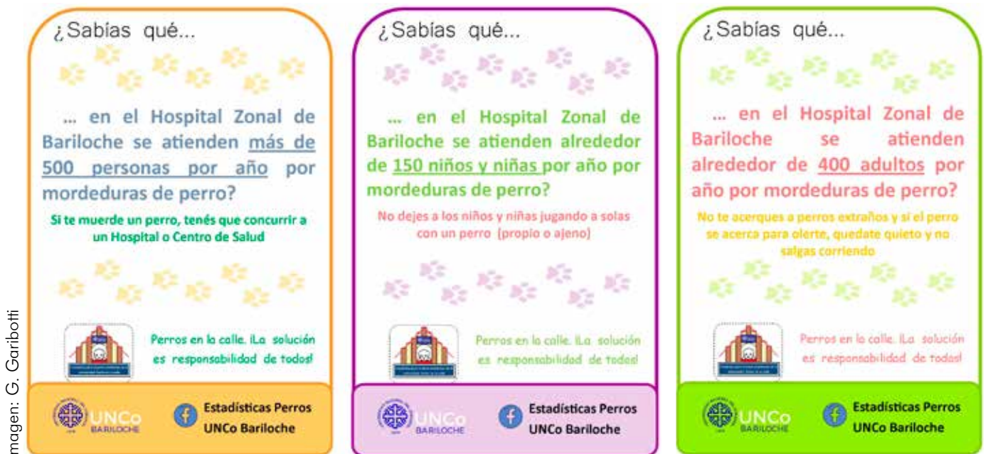
Imagen: G. Garibotti