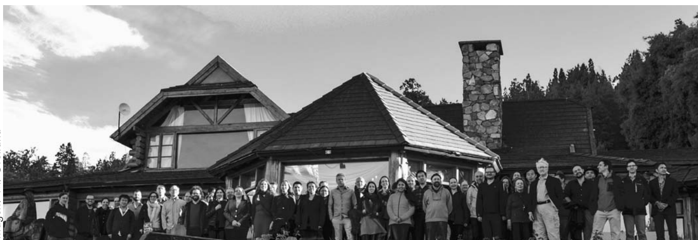
Los participantes del encuentro Distant Galaxies from the Far South , en uno de los eventos sociales del encuentro.

Aprendimos a lo largo del siglo XX que el universo no fue siempre igual: evolucionó a partir de un estado extremadamente denso y caliente, y 13.800 millones de años después todavía está expandiéndose y enfriándose. El universo joven era muy distinto del que vemos a nuestro alrededor. No había estrellas ni galaxias, sólo los elementos más simples: hidrógeno y helio, y radiación electromagnética. ¿Cómo llegó a ser como lo conocemos? ¿Cómo se formaron las primeras estrellas, las primeras galaxias? ¿Cómo eran, y cómo llegaron a ser como la Vía Láctea y el resto de las galaxias que vemos a nuestro alrededor? Preguntas como éstas reunieron en Bariloche, del 11 al 15 de diciembre de 2017, a los expertos mundiales de las "galaxias distantes". Este campo de estudio ha progresado enormemente en años muy recientes, y se espera que lo haga a paso acelerado, con la inminen-