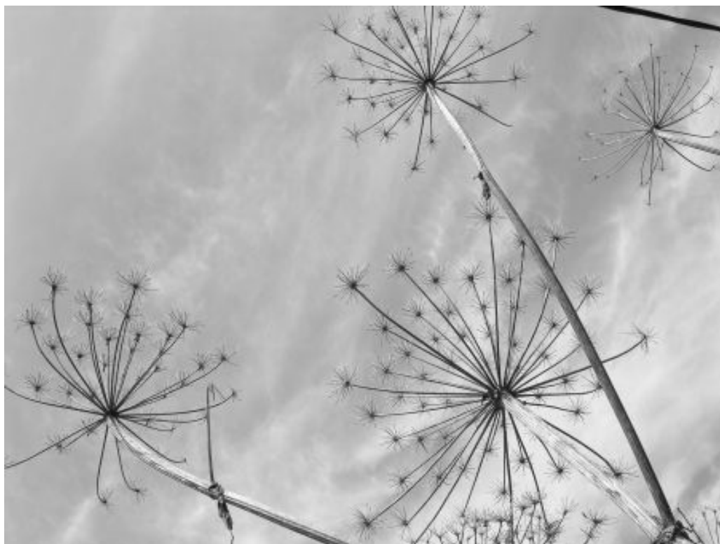
Fig. 5. Inflorescencias secas de Heracleum vistas desde abajo.

buena parte de la información hasta ahora brindada en este artículo proviene de estas fuentes.