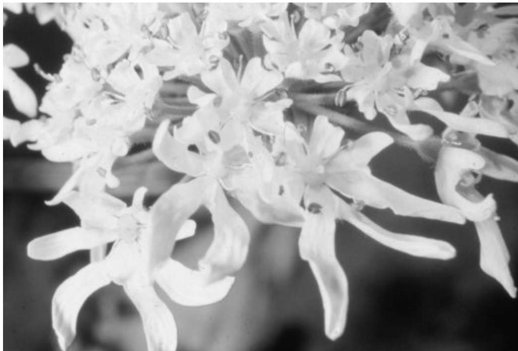
Fig. 3. Flores de Heracleum mantegazzianum .

del hombre) en sus alrededores. Para la República Checa se sabe que su introducción se produjo alrededor de 1865, en un jardín privado, pero su distribución en esa región no aumentó notablemente hasta bien avanzado el siglo XX. En otros 12 países de Europa, Heracleum también fue introducido en el siglo XIX. Para esa época no se tomaban muy en serio las invasiones de las plantas ni sus posibles efectos sobre la biodiversidad natural, así que las semillas de Heracleum iban y venían desprejuiciosamente por el mundo. En su período de mayor expansión en Europa, entre los años 1930 y 1990, se calcula que Heracleum duplicó su área de distribución cada nueve años. Hacia fines de ese período, los efectos negativos de esta planta se habían arraigado en el conocimiento popular.