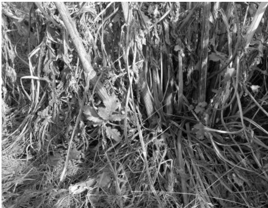
Fig. 7. Rebrote basal de una planta de Heracleum como respuesta al daño.

dios menos agresivos hacia el medio ambiente. Las pautas a seguir serían las siguientes: