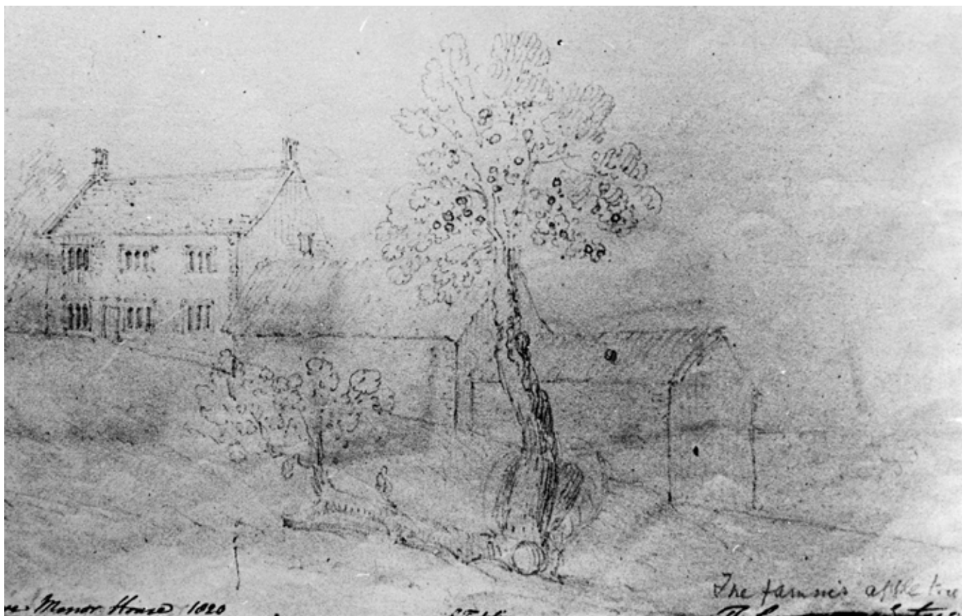
Figura 1. El manzano en casa de Newton, con dos troncos y dos copas tras la tormenta. Dibujo de Charles Turner (1820).

bajo los cuales el sabio pasaba horas en solitaria meditación, retoños del que había en el jardín de la casa de Newton.