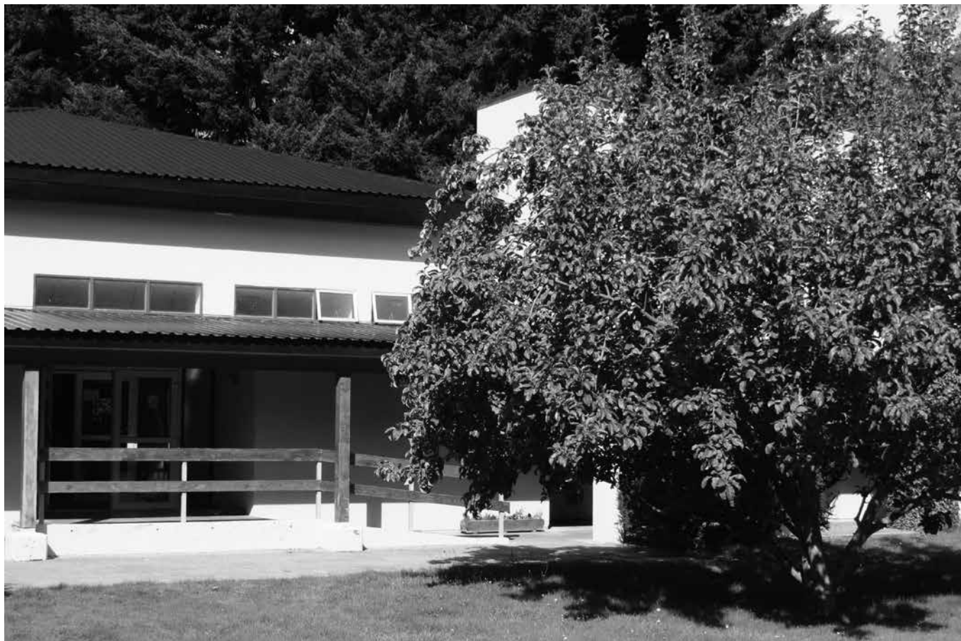
Imagen: G. Abramson