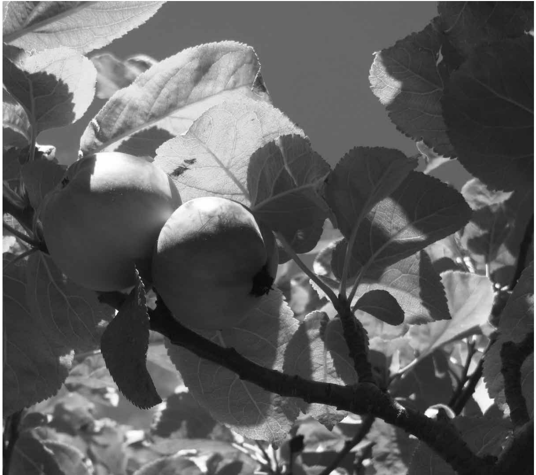
Imagen: G. Abramson