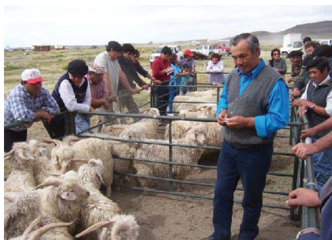
Feria de reproductores caprinos de Angora.

La EEA Bariloche cuenta con Agencias de Extensión Rural (AERs) que se localizan en Chos Malal, Zapala, San Martín de los Andes, Picún Leufú, Los Menuços, Ingeniero Jacobacci, El Bolsón y Bariloche. Los campos experimentales son dos: el Campo Anexo localizado en Pilcaniyeu, orientado a la producción ganadera (fundamentalmente ovina y caprina) de la estepa pa-