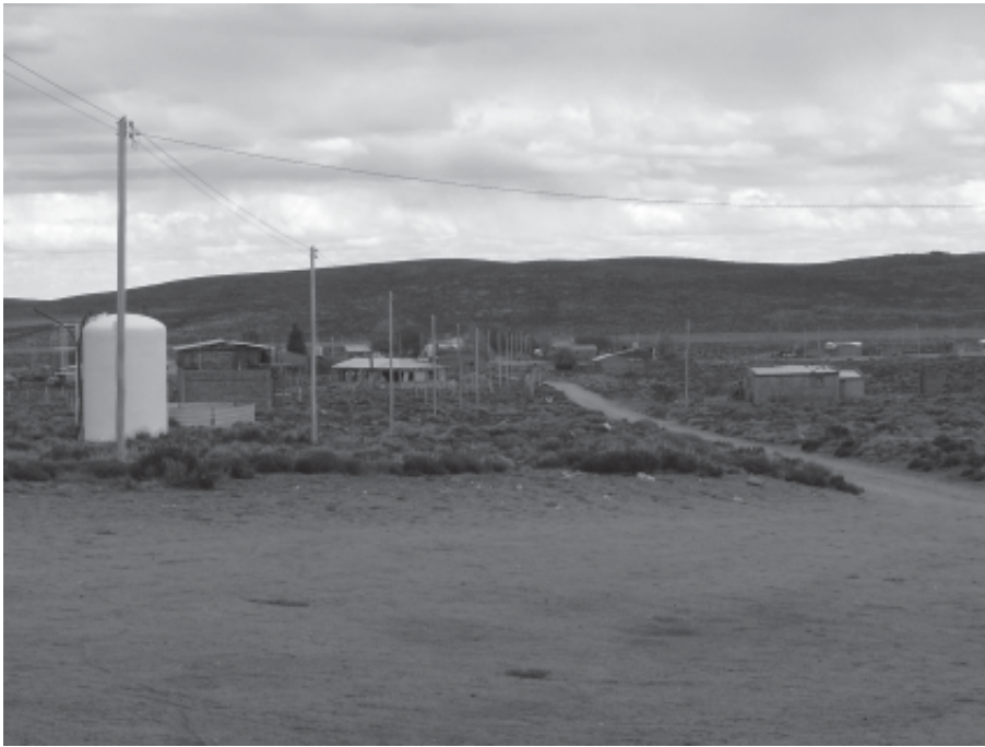
Figura 1. Vista de la entrada del paraje.

En este artículo daremos cuenta de algunos de los aspectos más relevantes de un trabajo más amplio de investigación etnobotánica sobre el uso de leña en comunidades rurales asentadas en la estepa patagónica, como es el caso de Laguna Blanca.