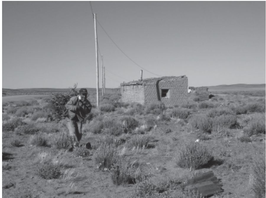
Figura 3. Poblador llevando michay, luego de haber recorrido más de 4 km.