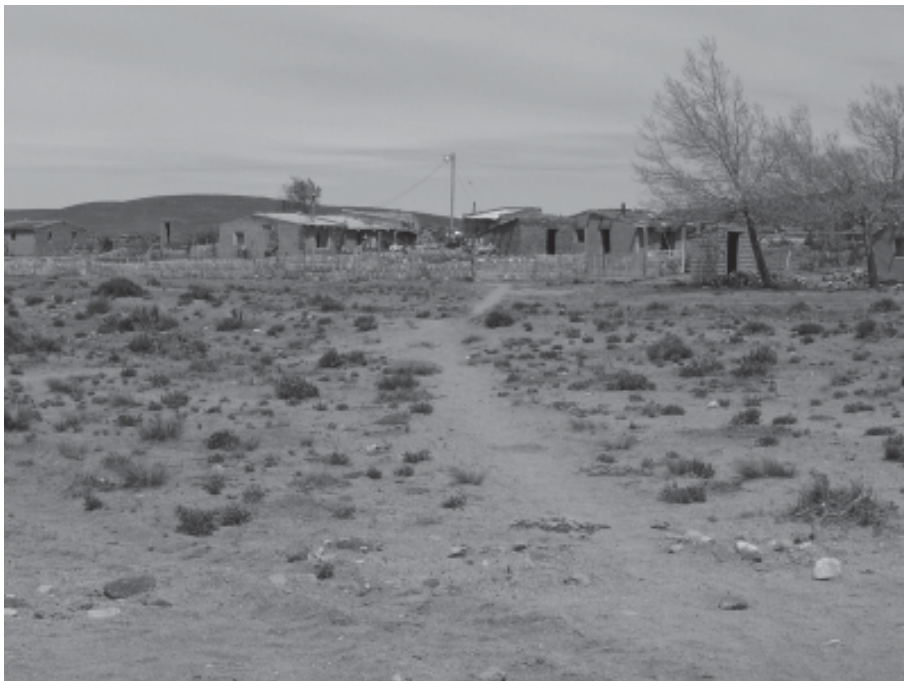
Figura 2. Cercos de botellas de plástico.

de Bariloche y a 90 kilómetros de Ingeniero Jacobacci, y a unos 1.300 metros sobre el nivel del mar. El paraje está rodeado por un paisaje en el que predominan los coirones, como el coirón dulce ( Festuca pallescens ) y el coirón amargo ( Pappostipa speciosa ), y arbustos como el neneo ( Mulinum spinosum ), el charcao gris ( Senecio filaginoides ) y el botón de oro ( Grindelia chilensis ). El clima es árido y frío, con vientos predominantes del oeste. La precipitación media anual es de entre 150 y 300 milímetros y la temperatura media anual es de 8 a 10 °C. Estas características reflejan un ambiente hostil para la vida humana (ver Figura 2).