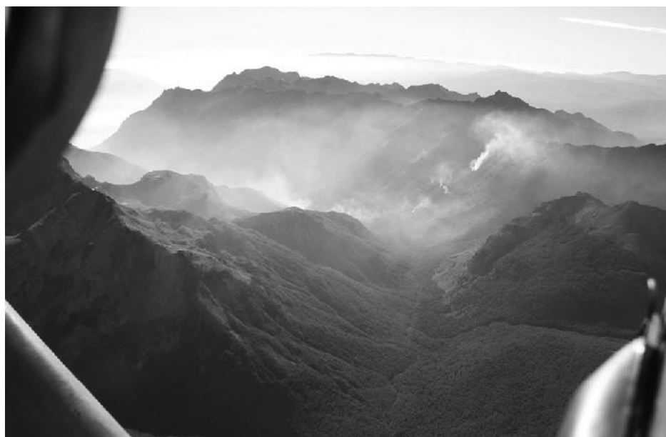
Imagen: D. Wegrzyn

Más allá de los motivos que dieron origen al foco inicial, luego de 48 horas de detectado el incendio forestal de la cuenca del Rio Tigre en Cholila, las llamas se extendieron rápidamente a las sub-cuencas cercanas y luego de más de un mes de combate, el incendio fue detenido finalmente por las esperadas lluvias. Se utilizaron para combatirlo más de 500 combatientes forestales, 7 aviones, 4 helicópteros, invirtiéndose millonarios recursos en el dispositivo operativo de combate. Sin dudas, de este evento excepcional cuyo combate ampliado involucró la intervención de personal y equipos de 7 jurisdicciones y del Ejército Argentino. Existen numerosas lecciones de las cuales los organismos correspondientes, sacarán conclusiones que implican nuevos aprendizajes, relacionados a la detección temprana, efectividad del ataque inicial, coordinación interinstitucional, comunicación a la sociedad, herramientas de toma de decisión y priorización de áreas críticas.