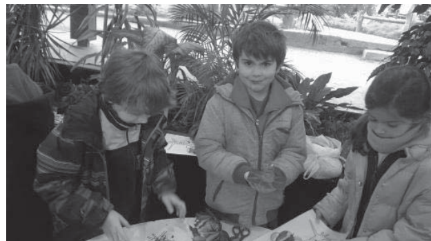
Alumnos de las escuelas mostrando sus producciones

En los últimos años se intensificaron las podas excesivas y fuera de época en los árboles urbanos de Bariloche, que en muchos casos ocasionaron su muerte. Asimismo, son notorias las deformaciones de la arquitectura típica de cada especie de árbol que se