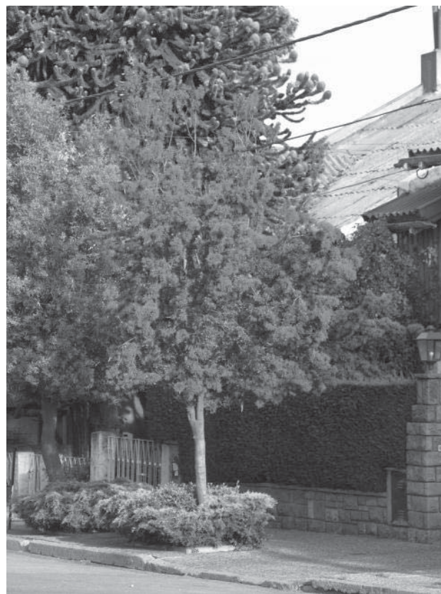
Notro en flor (árbol nativo), en calle Gallardo

nismos relacionados con el manejo de los árboles y los bosques de Bariloche, como la Dirección de Parques y Jardines y la Secretaría de Medio Ambiente de la Municipalidad, el Servicio Forestal Andino, el Servicio de Prevención y Lucha contra Incendios Forestales, el Instituto Nacional de Tecnología Agropecuaria, el Ente Jardín Botánico de Bariloche, la Defensoría del Pueblo, y el Colegio de Arquitectos. A pesar de algunas ausencias por parte de los responsables municipales directos del cuidado del arbolado urbano, se debatieron entre los presentes las dificultades y posibles soluciones para la implementación de la Ordenanza. Se consensuó sobre la necesidad de volver a formar una comisión interinstitucional (que alguna vez existió) para debatir y asesorar a los responsables sobre